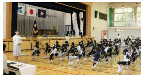
111名が入学し、全校児童688名となりました。

児童会や各学級役員を中心に、よりよい学校・学級になるようにみんなで協力して学習や生活に取り組んでいます。19日（水）と21日（金）には、各学級の授業参観と学級懇談が行われました。多くの保護者の方に参加いただき、ありがとうございました。