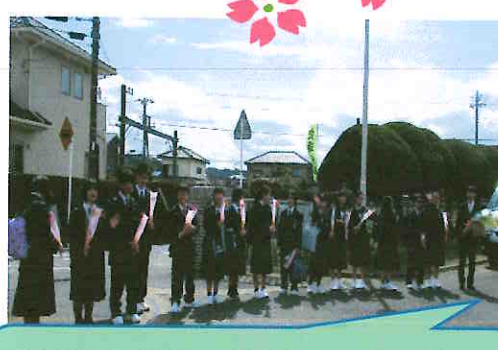
校門を出る前に、整列した6年生が 大きな声で 「ありがとうございました！」