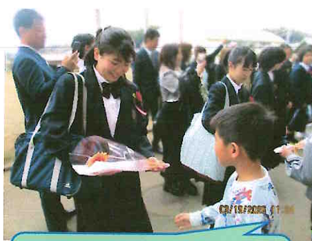
お世話になった1年生から お花のプレゼント！