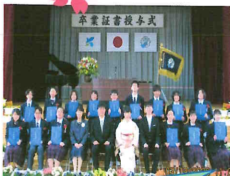
卒業証書を手 みんないい顔をしています！