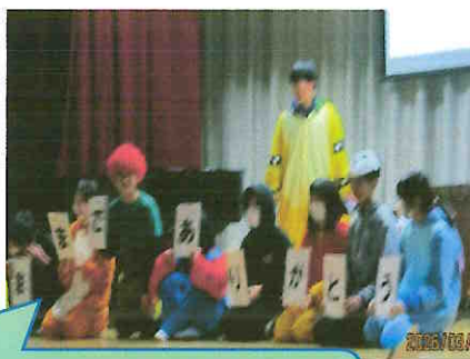
かわいい笑顔が揃いました。