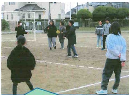
熱戦がつづいたドッジボール大会！

卒業式まであとわずかです。15名の門出がすばらしいものとなるように、心をこめて準備をしたいと思います。