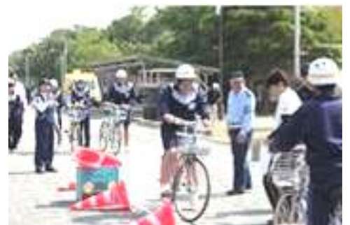
過去の実施校での様子

実技の内容はこんな感じ ・コーンの間をジグザグに走行する。 ・傘をさしながら、片手で運転する。 ・水を入れた思いペットボトルを前かごに積んだ状態で走行する。など さぁ代表者たちは、うまく運転できるでしょうか?