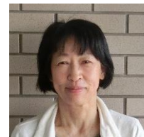
先生 (せんせい) ※ 先生は、初めて瑞穂小に来てくれました

月に1~2回、瑞穂小学校に来ていただき、みずほっ子の心に寄り添ってくれます。みずほっ子が何かに悩んだ時、先生たちが悩んだ時に相談にのってくれるカウンセリングのプロです。本当にありがとうございます。