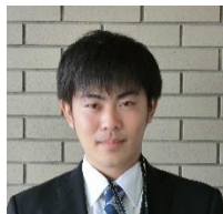
先生 (せんせい) ※ 先生は、初めて瑞穂小に来てくれました

月に2回、瑞穂小学校に来ていただき、一人一台端末を使った授業の際、みずほっ子のサポートや先生たちのサポートをしてくれるICT機器のプロです。先生たちもたくさん教えてもらっています。本当にありがとうございます。